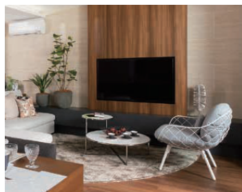
壁付けテレビと壁面タイル