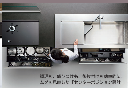
調理も、盛りつけも、後片付けも効率的に。 ムダを見直した「センターポジション設計」