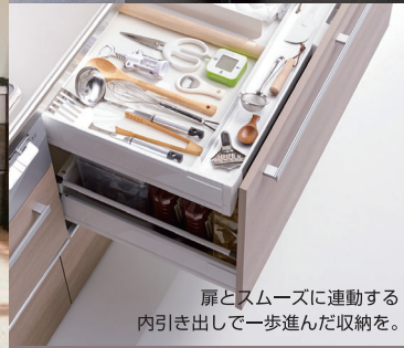
扉とスムーズに運動する 内引き出しで一歩進んだ収納を。