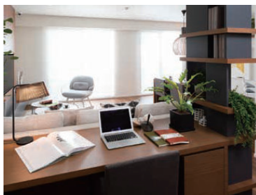
リビング一角のワークスペース

ライフスタイルにぴったりフィットした住まいで心地よい空間へ。お住まい心地を向上させるリフォームをご提案します。