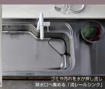
ゴミや汚れを水が押し流し 排水口へ集める「流レールシンク」